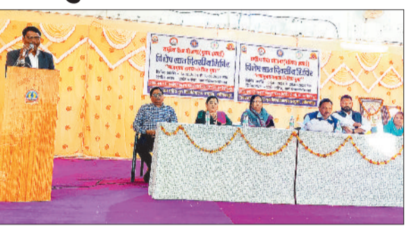
कार्यक्रम के दौरान उपस्थित अतिथि।