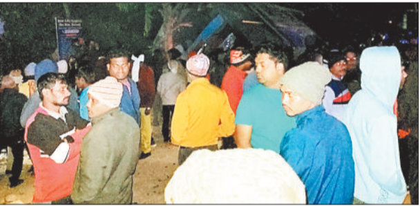
घटना के बाद मची अफरा-तफरी।