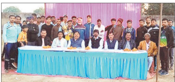
क्रिकेट प्रतियोगिता का आनंद लेते अतिथि।