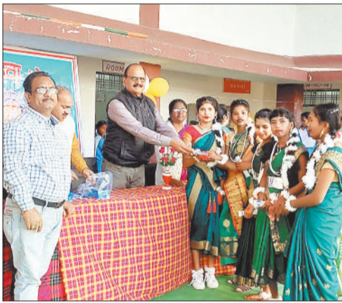
प्रतियोगिता के विजेता को पुरस्कृत करते अतिथि।