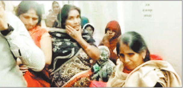
अस्पताल में घायल लोग।