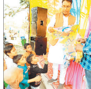
बच्चों को पतंग देते कार्यसमिति सदस्य।