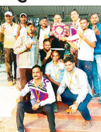
शील्ड के साथ खिलाड़ी।

बैकुंठपुर। अंबिकापुर के नगर सेना क्रिकेट ग्राउंड में संचालित संभाग स्तरीय क्रिकेट टूर्नामेंट का फाइनल मुकाबला रविवार को कोरिया एवं सरगुजा की संयुक्त टीम व जशपुर एवं बलरामपुर की संयुक्त टीम के मध्य खेला गया। इसमें कोरिया एवं सरगुजा की संयुक्त टीम 38 रनों से विजयी रही।