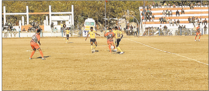
मैच के दौरान फुटबाल खेलते खिलाड़ी।