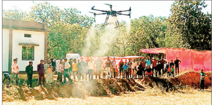
ड्रोन से किया गया दवा का छिड़काव।