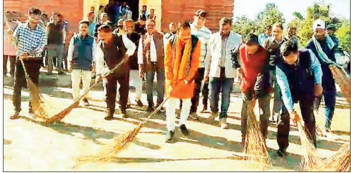
झाड़ू लगाकर स्वच्छता का संदेश देते स्वास्थ्य मंत्री।